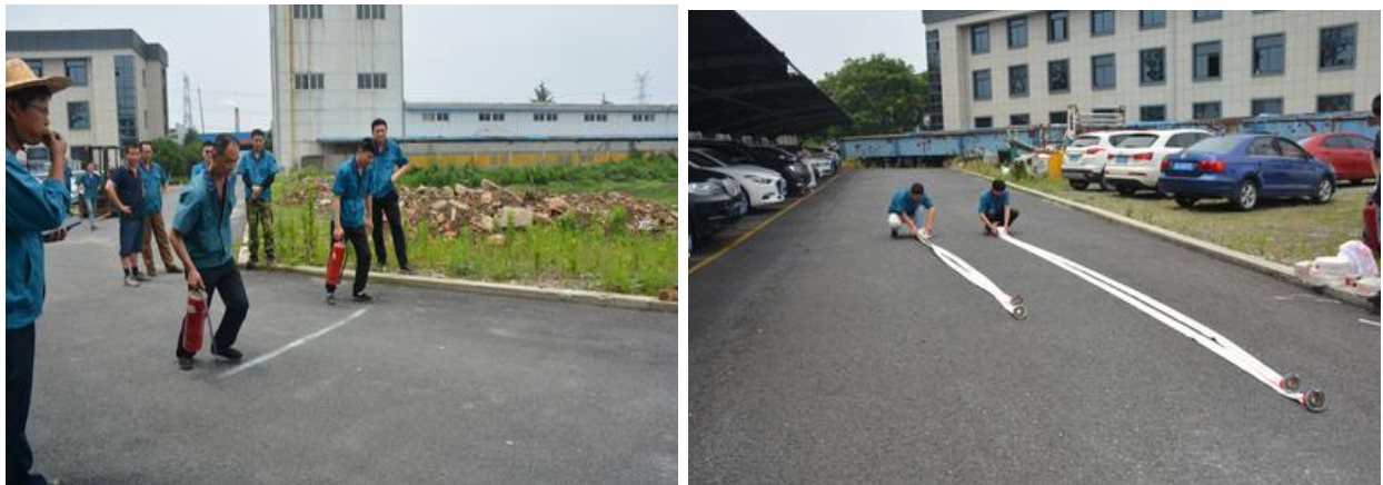
图 6.3-01 2020 年火灾应急演练记录

新利作为一个生产型的企业，在保障企业连续生产上，既是安全的需要，也是保障顾客利益的需要。因此，公司对于影响生产连续运行的重大因素都采取双保险措施，或制定有《应急计划管理流程》、《应急计划实施细则》以及一系列具体针对某项风险而制定的应急预案。根据风险等级和发生的可能性评估危险情况如停电、火灾、疾病、工伤、关键设备故障等，为此制定有一备一用方案，方案中包括预防计划和应急计划两部分，同时实行定期演习。