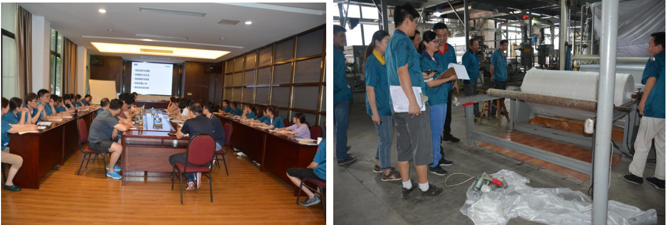
图 3.2-1 各类培训活动

随着公司的高速发展，在培训工作上越发显得重要。培训需求的识别首先从部门级开始，部门负责人及相关人员从六大方面识别培训需求。公司根据各部门上报的培训需求，结合战略要求，加入对高层领导和中层干部的需求计划，在此基础上整合和编制形成员工年度培训计划，审批后由 HR 中心下发文件并负责组织实施。公司并成立了“新利商学院”，见图 3.2-1 所示。