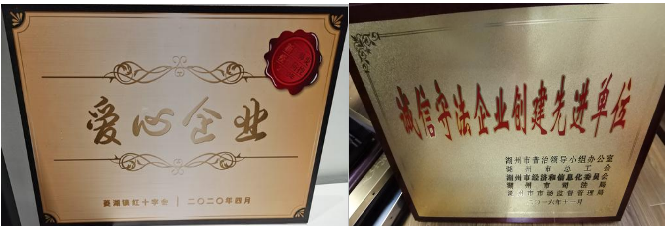
图 3.3-1 各种荣誉证书（示例）

公司恪守商业道德，坚持诚信经营和公平竞争原则。公司从多年的经营实践中总结提炼的价值观就是“开拓创新、追求卓越、诚恳守信，共同发展”，并以此为准绳奉行不止，高层领导带头学习《公司法》、《产品质量法》、《环境保护法》、《劳动法》等法律法规培养对客户讲诚信，重合同，守信用；对社会讲诚信，守公德，行公益的行为准则。公司每年销售交易额翻倍增长，公司从不违约，也从不因为价格、质量、交货期、收付款等问题与客商发生过纠纷，深受国内外客户的信赖。为此，公司先后获得政府颁发的“2019 年慈善贡献单位”、“诚信守法企业创建先进单位”、“浙江省工商企业信用 AA 级守合同重信用单位”等荣誉，如图 3.3-1 所示：